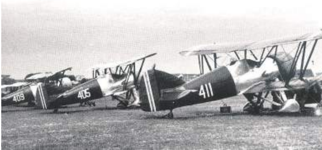
De tre Scimitar jagerfly som simulerte angrep på Stavanger lufthavn 31. mai 1937.

Ellers kjenner vi til flyulykken med Scimitar jagerfly under simulert angrep under siste dag av det tre dagers åpningsstevnet på Stavanger lufthavn Sola mandag 31. mai 1937. Et Scimitar jagerfly havarerte under simulert stupangrep mot flyplassen der flyet fløy i bakken og flygeren omkom. Flyet var det tredje og siste flyet i en tre ship formasjon som angrep i stup en etter en. Det var det tredje og siste flyet som fløy i bakken.